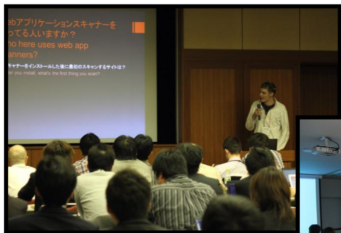
“OWASP Night” Meeting

2012年以降、3ヶ月に一度の定期的なミーティングやイベントの参画により、2013年11月までに、のべ2,000名もの人材が参加しています。参加者には、開発者、研究者、企業の情報ガバナンス担当者、マーケティング関係者などウェブに関係する幅広い人々がいます。国内外からこぞって講師が来日し、ボランティアで参加しています。また、ご賛同いただける企業から会場提供等のご支援を頂いています。