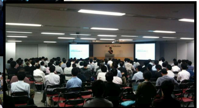
“OWASP Night” Meeting