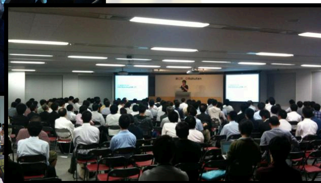
“OWASP Night” Meeting